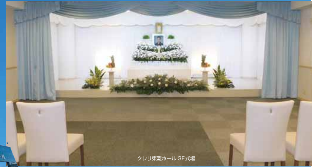
クレリ東灘ホール 3F式場