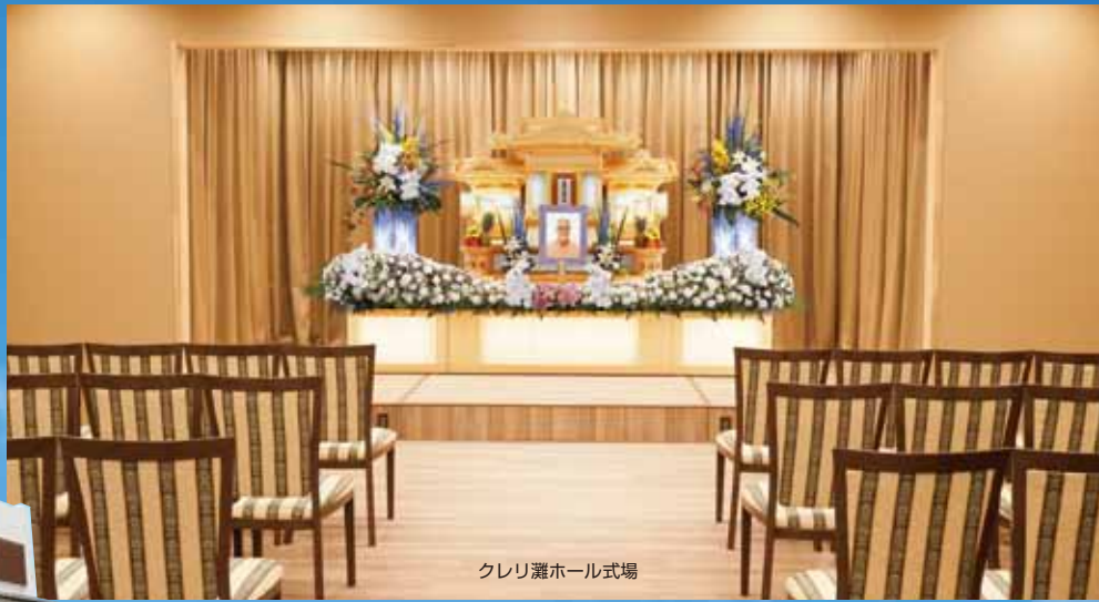
クレリ灘ホール式場