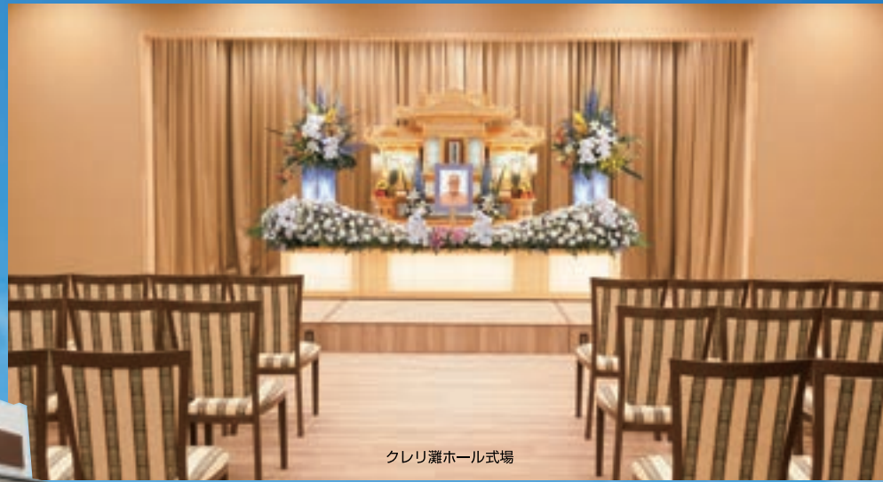
クレリ灘ホール式場