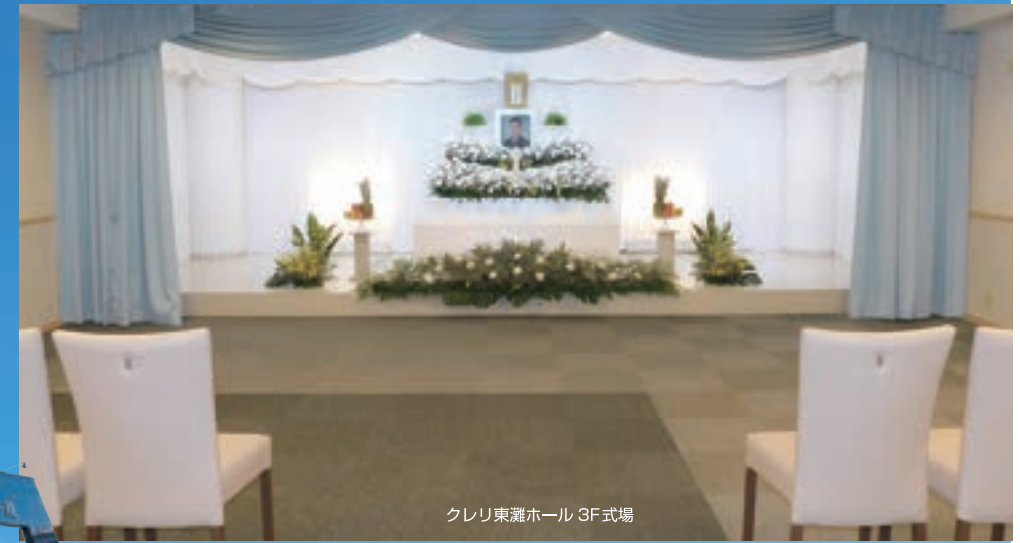
クレリ東灘ホール 3F 式場